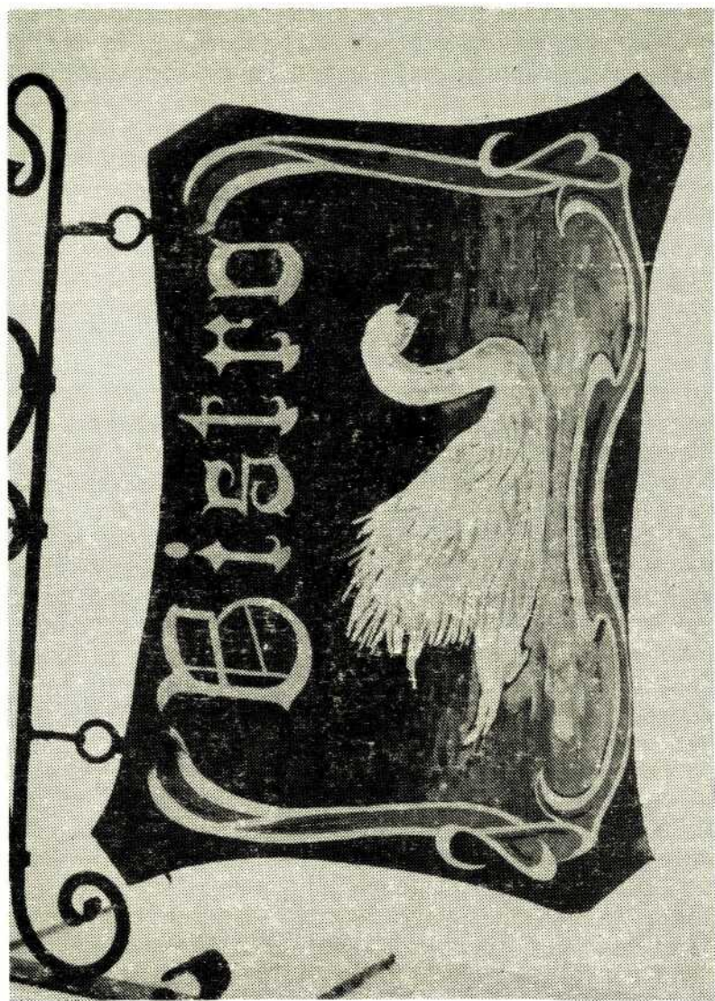
Uithangbord van bistro "'t Swaentje"