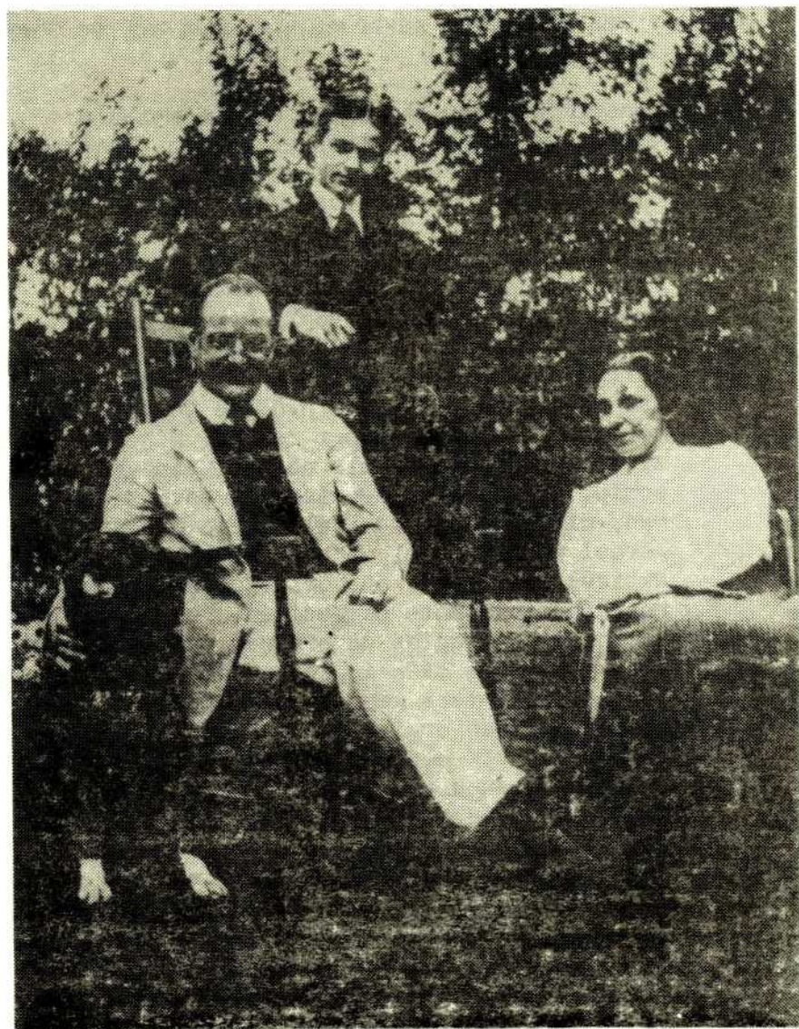
H. en R.N.Roland Holst, staande de dichter A.Roland Holst